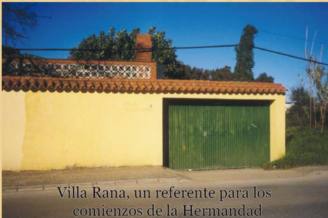
Villa Rana, un referente para los comienzos de la Hermandad